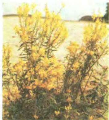
644. Льонок звичайний.